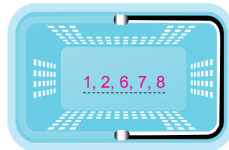
Hava Olayları Sepeti